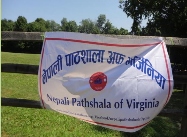
NEPALI Pathshala of Virginia