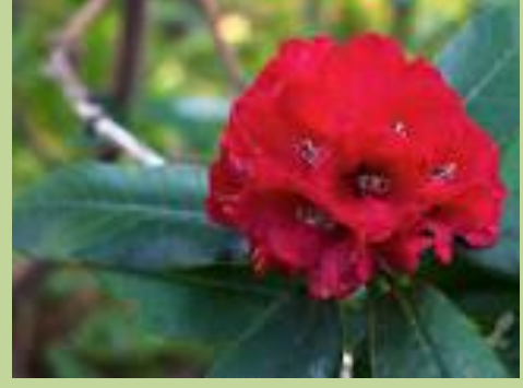
National flower of Nepal

We are very proud to have you all in our Nepali Pathshala. This is the journey we all are taking together where everyone is empowered to create a structural learning environment for our children and build a true and healthy relationship among us to serve the society where we live.